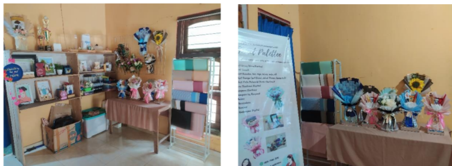
Gambar 1. Studio Online Shop “Sweet Palettee”

Dari objek penelitian dan informan yang disebutkan diatas, maka penelitian ini akan menganalisis penggunaan aplikasi pencatatan keuangan Money+ pada online shop “Sweet Palettee” berdasarkan teori Technology Acceptance Model (TAM) yang dilakukan dengan metode wawancara, observasi serta melalui rekaman arsip.