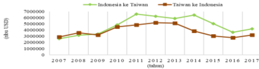
Gambar 1. Ekspor Bilateral antara Indonesia dan Taiwan